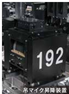
吊マイク昇降装置