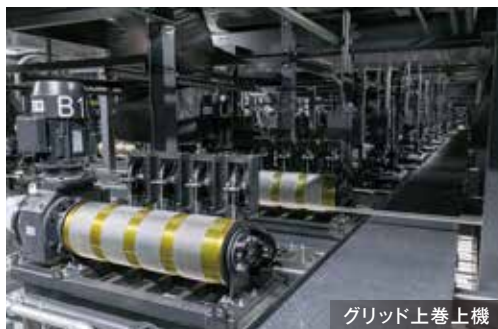
グリッド上巻上機